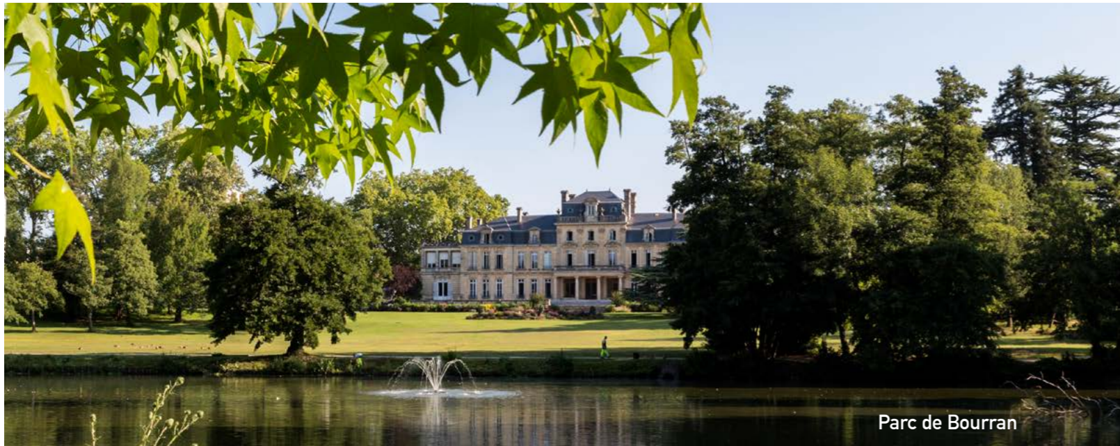
Parc de Bourran