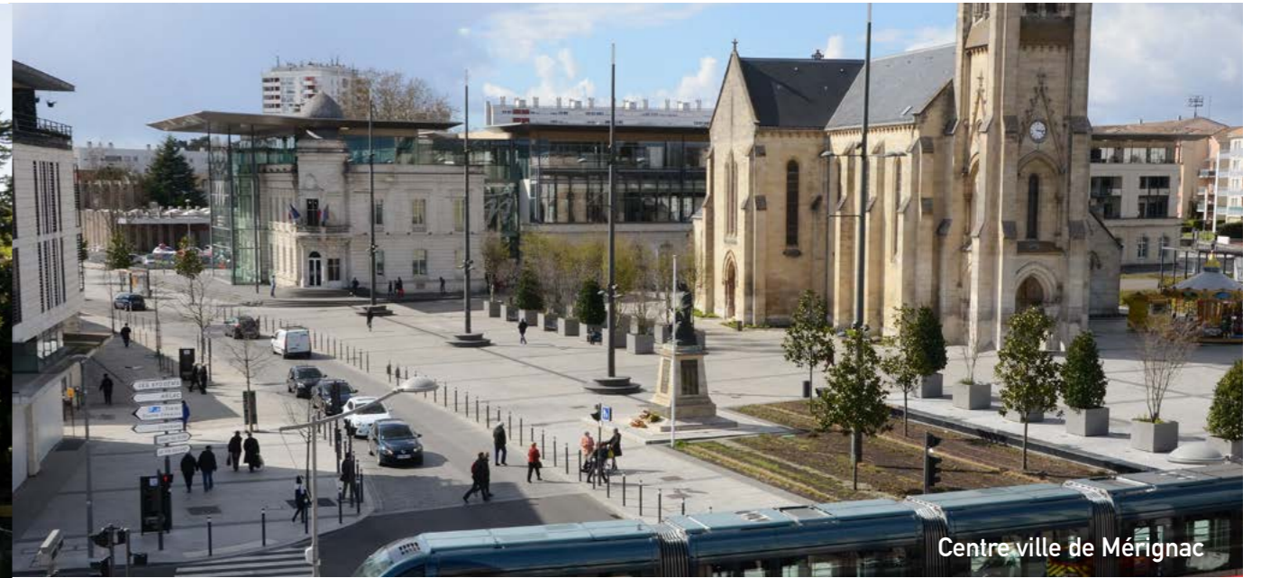
Centre ville de Mérignac