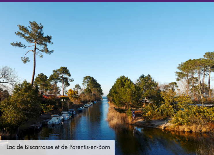
Lac de Biscarrosse et de Parentis-en-Born